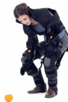
Bewegung im Altersanzug selbst erleben