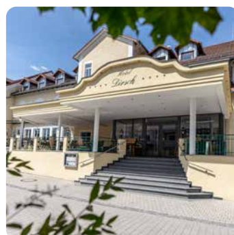
Hotel Dirsch, Emsing