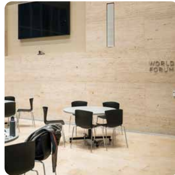
Perry World House, University of Pennsylvania

ca. 16:30 Uhr Ende der Veranstaltung und individuelle Abreise