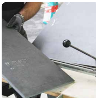
Schneiden von großformatigen Platten

Wir arbeiten mit den Systempartnern Karl Dahm, Schwenk und Florim zusammen.