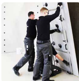
Verlegung der Platten mit Spezialwerkzeugen