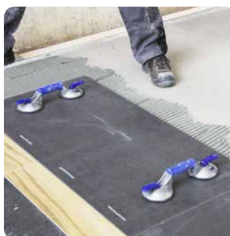
Verlegung der Platten mit Spezialwerkzeugen