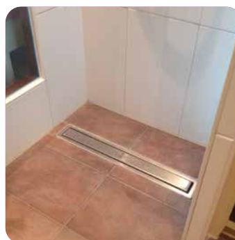
Duschrinne in bodengleicher Dusche