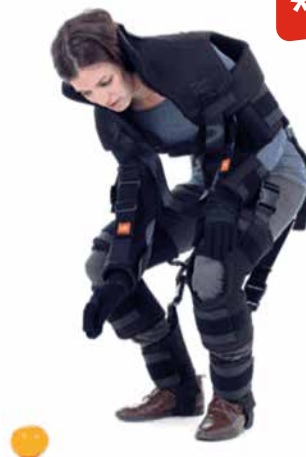
Bewegung im Altersanzug selbst erleben