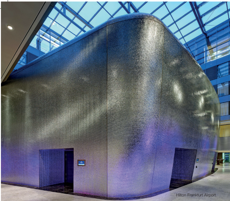
Hilton Frankfurt Airport